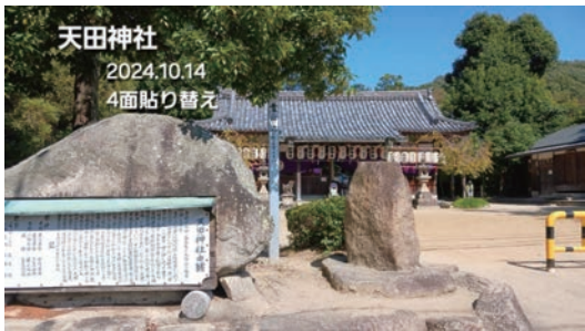
天田神社 2024.10.14 4面貼り替え

■次は天田神社。社務所はお休みで不在。車道から良く見える場所にPP。1枚だけ真っ白。アルバムの中にある電話番号で宮司さんに挨拶。明日は神社でお祭りの事。御礼とプレートの貼り替えの了解を頂く。1枚だけ本体と違う色のプレートに違和感を覚え4面とも新しいプレートを貼り替えて綺麗に。明日のお祭りが賑やかでありますように。